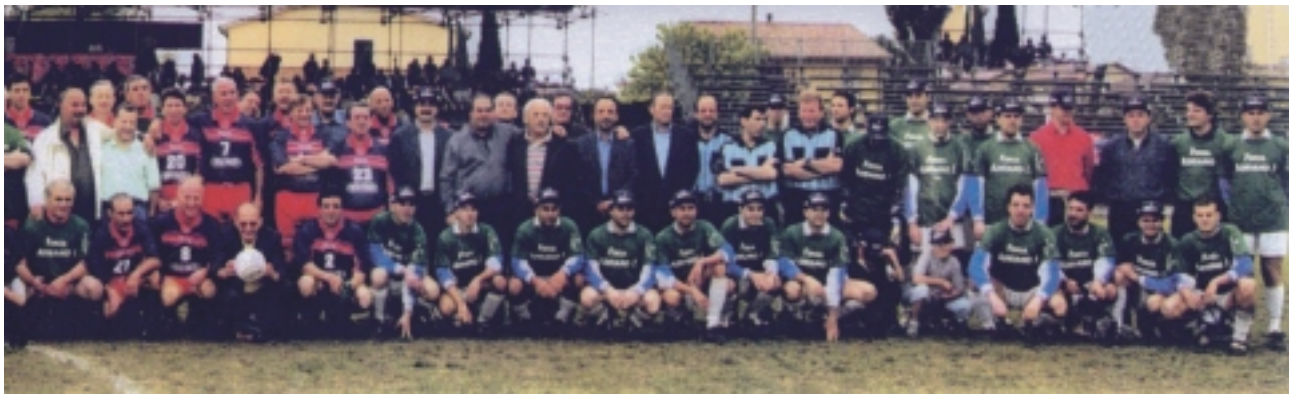
Le formazioni della partita "Per Adriano" del 10 Maggio 2003

Per la cronaca la partita è stata vinta dalla formazione dei dipendenti della Banca con il punteggio di 2 a 1.