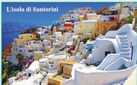
L'isola di Santorini