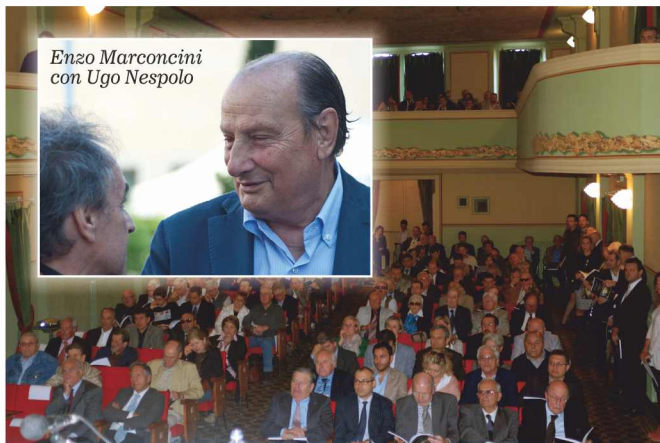
Maggio 2013, L'assemblea dei soci al Teatro di Lajatico

Nel corso dell'assemblea dei soci tenutasi a Lajatico a maggio, il Consiglio di Amministrazione ha sentitamente ringraziato il Presidente uscente per l'opera prestata con solerzia, professionalità e profonde doti umane, consentendo alla Banca di affermarsi come un punto di riferimento fondamentale per l'economia provinciale.