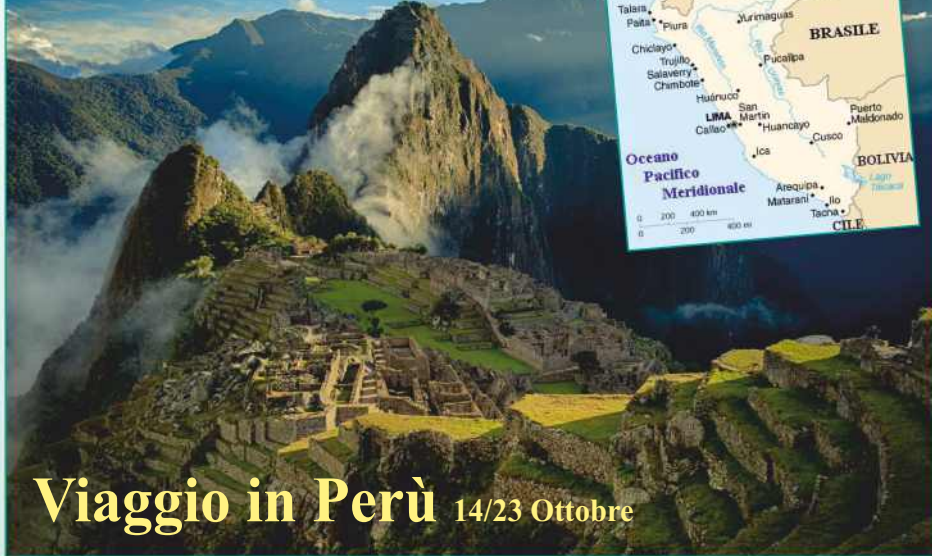
PERÙ Machu Picchu